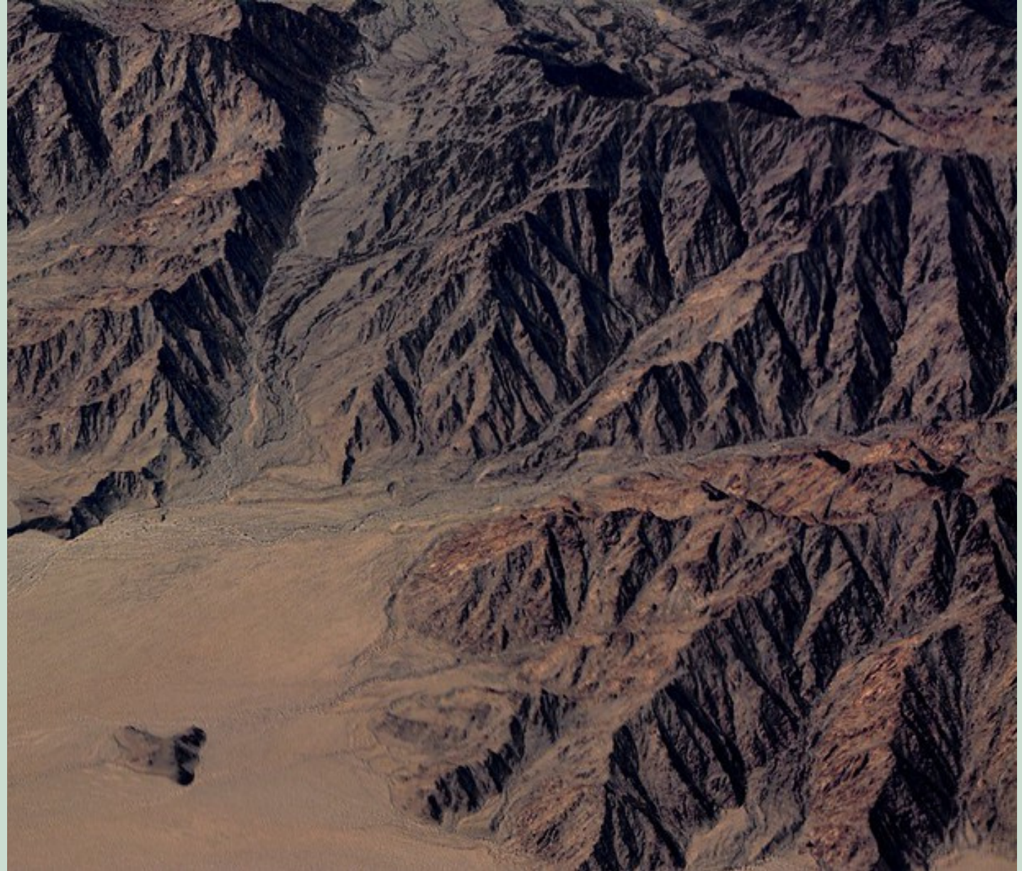
PHOTO: "DESERT HEIGHTS" BY SCOTT ROBINSON. CHANGES MADE. HTTPS://CREATIVECOMMONS.ORG/LICENSES/BY/2.0/